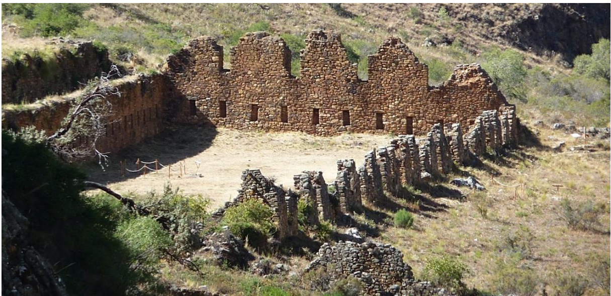
Complejo arqueológico de Inkallajta.

Los caminos y los camélidos cumplieron un rol fundamental para generación de un tráfico de caravanas, articulando los centros productivos en las diversas áreas dominadas por los incas. En ese ámbito general se desarrolla el capítulo Los pastores y sus caravanas en la era del Tawantinsuyu , de los doctores Axel Nielsen y Juan Maryański. Ellos destacan la importancia del pastoreo de estos animales en relación con la agricultura, así como plantean evidencias que sugieren la probable existencia de razas especializadas de camélidos domesticados hoy extintos. Por esa razón, los centros ganaderos que tuvieron los incas habrían abastecido al resto del territorio. Los autores sugieren la hipotética existencia de ejes caravaneros estatales que llevaban camélidos de norte a sur y viceversa, al que se superponía otro este-oeste.