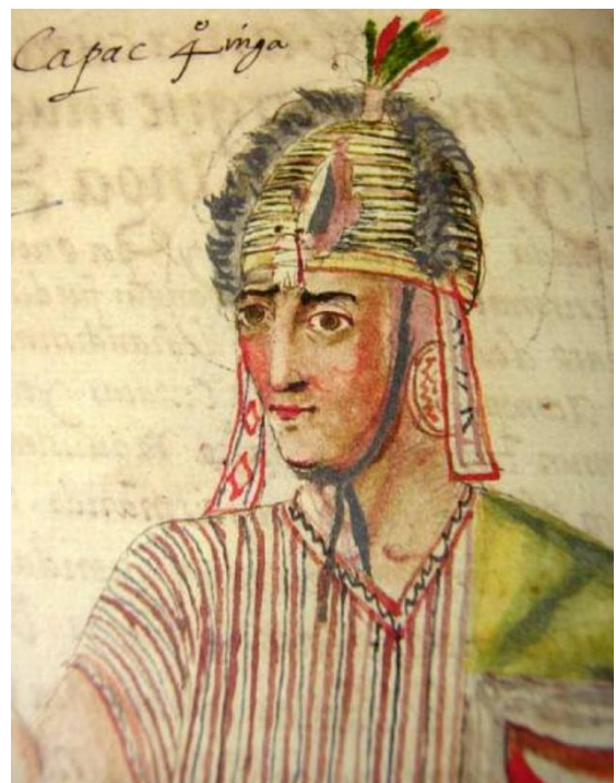
El inca Cápac Yupanqui. Fr. Martín de Murúa, 1617.

Es importante indicar que cada texto no pretende encontrar consensos en la comunidad científica, por el contrario, busca encender el debate sobre los aspectos divergentes. Esto es reforzado al final de cada contribución intelectual donde se acaba con una discusión, cuyas conclusiones tratan de despejar dudas e interrogantes acerca de los temas tratados y en todo caso, estimulan al emprendimiento de nuevas investigaciones sobre estudios que no tienen por qué considerarse terminados. El libro está dividido en cuatro partes, que se a su vez se subdividen en capítulos. La primera de ellas se titula Fuentes escritas, orígenes y formaciones , que se extiende en cuatro capítulos.