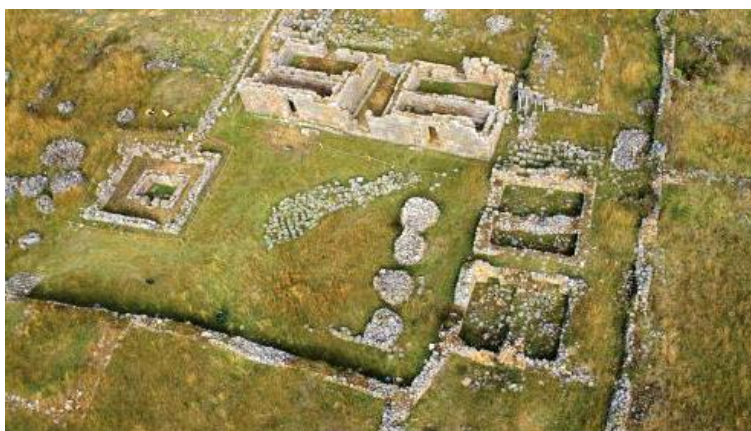
Sector del centro administrativo de Huánuco Pampa