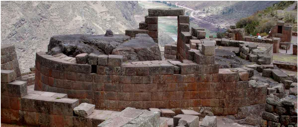
Detalle del complejo arqueológico de Pisac.

sometido, brindaron de toda una variedad y vastedad de recursos al Estado. Igualmente aborda otros temas transversales y no menos importantes, como los rebaños de camélidos, las áreas de cultivo, los ceramios y textiles, así como la infraestructura compuesta por los almacenes y caminos.